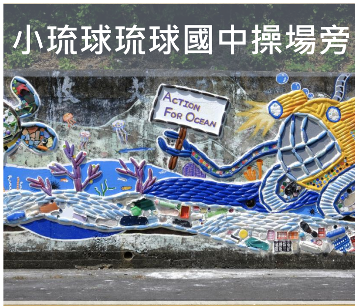
小琉球琉球國中操場旁