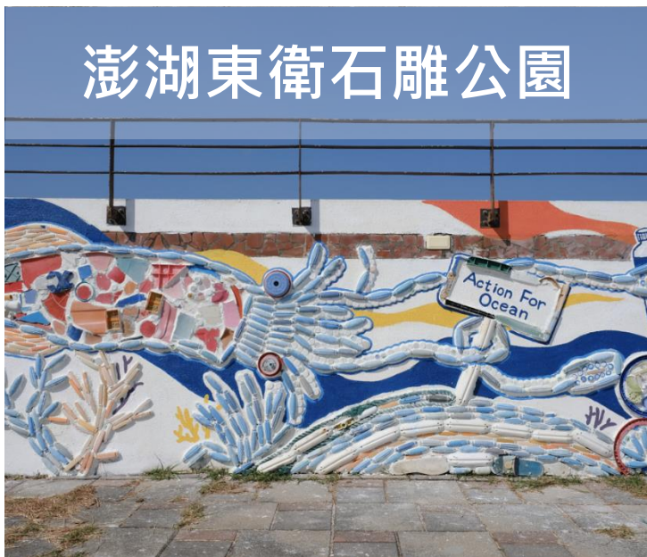
澎湖東衛石雕公園